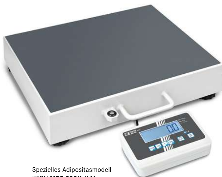
Spezielles Adipositasmodell KERN MPC 300K-1LM