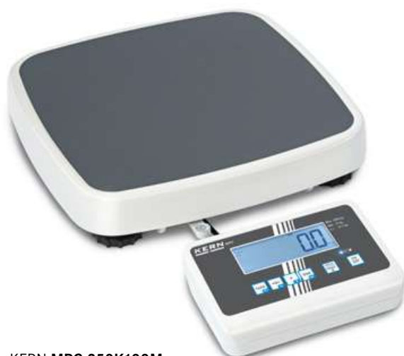
KERN MPC 250K100M

Kompakte Personenwaage mit Eich- und Medizinzulassung für den professionellen Einsatz in der medizinischen Diagnostik