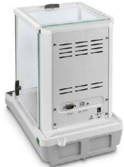
KERN ACS/ACJ mit serienmäßiger Datenschnittstelle RS-232 und USB

Der Bestseller unter den Analysenwaagen, mit hochwertigem Single-Cell Wiegesystem, auch mit Eichzulassung [M]