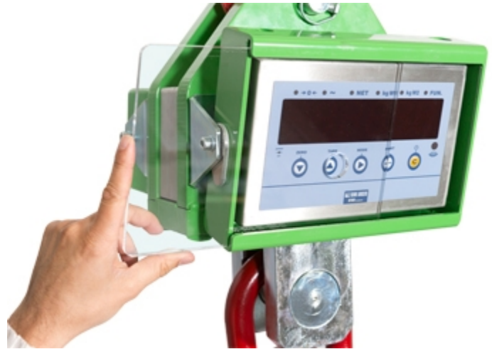
Schutzscheibe aus Plexiglas für Display und Tastatur