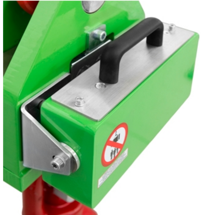
Serienmäßiges austauschbares Batteriefach